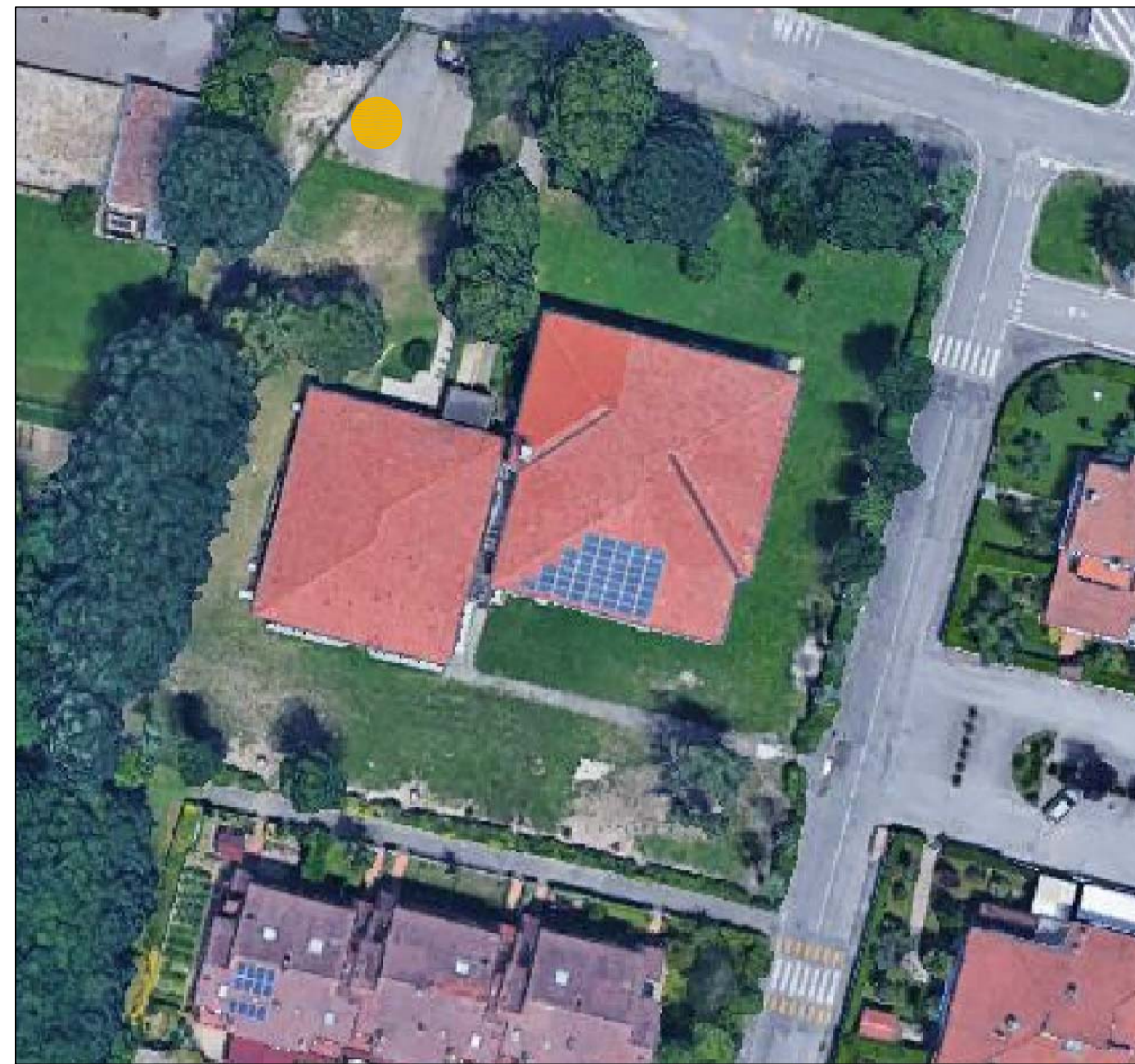
INDIVIDUAZIONE DEL PUNTO DI RACCOLTA ORTOFOTO